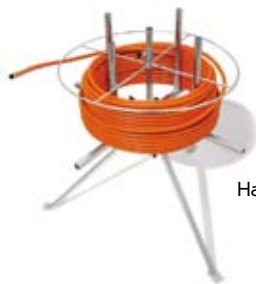
Haspel voor buis, dit scheelt 1 man op de werkvloer.